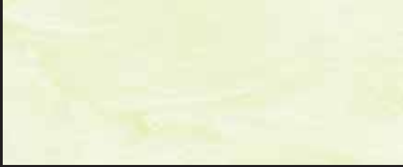
KREOS BIANCO WHITE