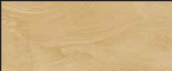
KREOS BIANCO WHITE