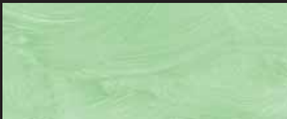
KREOS BIANCO WHITE