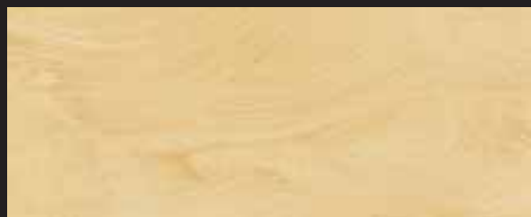
KREOS BIANCO WHITE