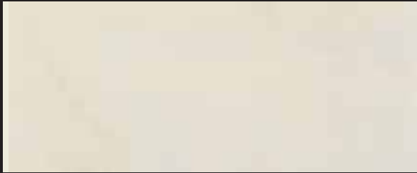
KREOS BIANCO WHITE