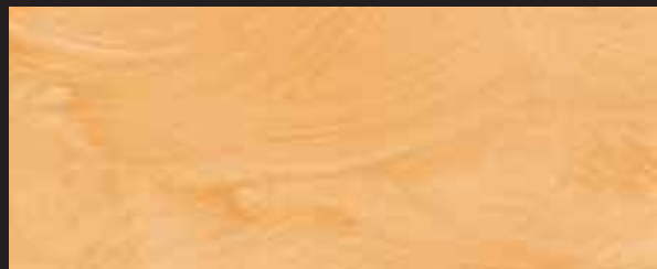
KREOS BIANCO WHITE