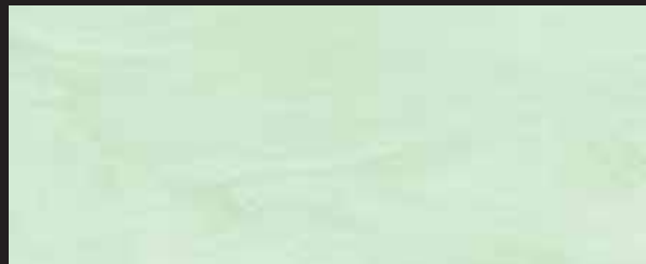
KREOS BIANCO WHITE