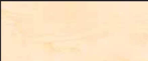
KREOS BIANCO WHITE