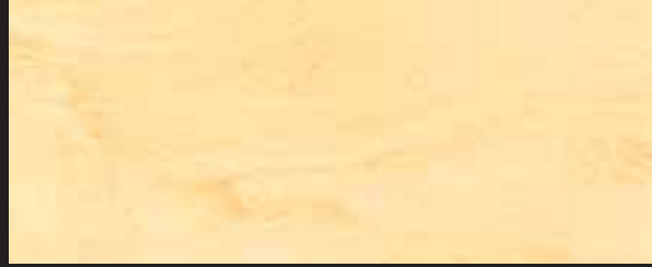
KREOS BIANCO WHITE