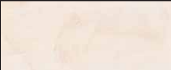
KREOS BIANCO WHITE