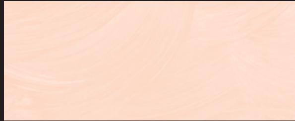
KREOS BIANCO WHITE